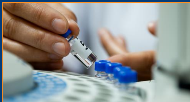
Rynek produktów leczniczych